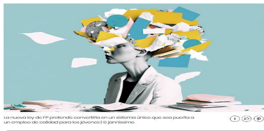
La nueva ley de FP pretende convertirla en un sistema único que sea puerta a un empleo de calidad para los jóvenes

La nueva Ley Orgánica de Ordenación e Integración de la Formación Profesional 3/2022 aprobados en el 2022 por el Ministerio de Educación y Formación Profesional pretende una transformación global del sistema de Formación Profesional y convertirlo en un sistema único que sea puerta a un empleo de calidad para los jóvenes , capaz de responder con flexibilidad a los intereses, las expectativas y las aspiraciones de cualificación profesional de las personas a lo largo de su vida y a las demandas de los sectores productivos.